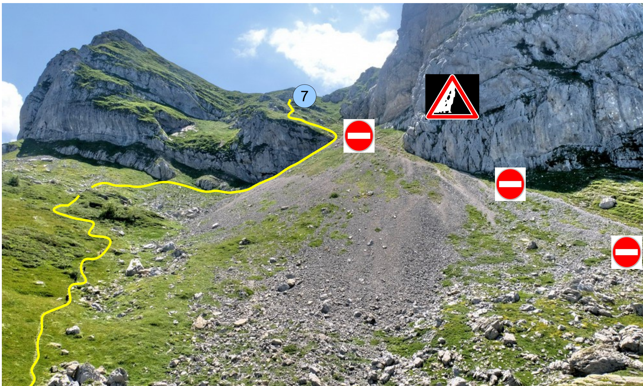
6 Nouveau passage par la gauche, éviter absolument la droite du « Pas de l'Escala »