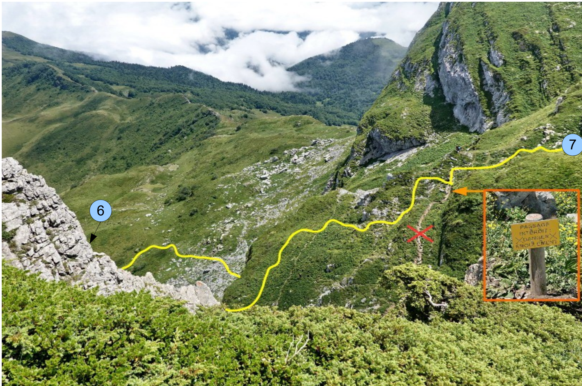
Vue arrivée depuis le Haut